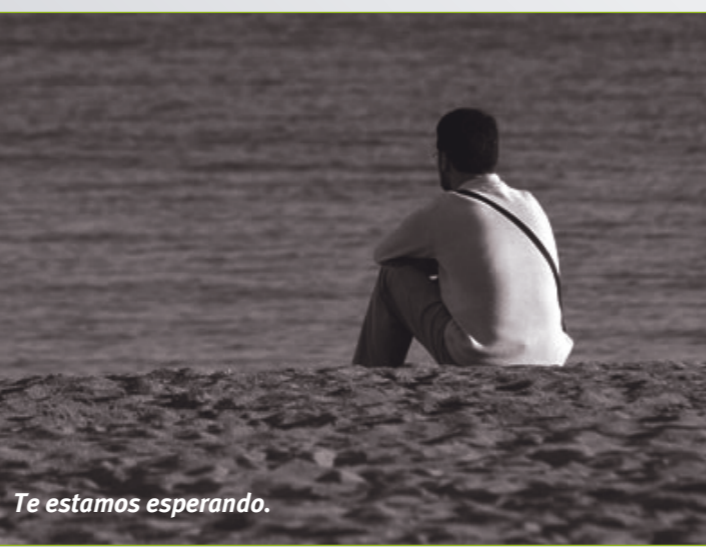
Te estamos esperando.

Si querés empezar a compartir este camino, podés anotarte en rrii@mah.org.ar o por teléfono al 4382-8275 Int. 30.