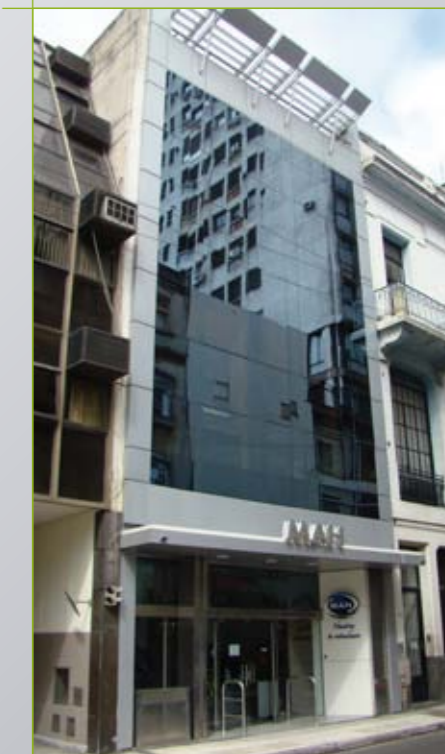
Edificio Sede Central, MAH

Este conjunto de acciones que ya hemos llevado a adelante, responden a la necesidad de continuar invirtiendo en una mejor calidad de servicio en la atención de nuestros socios.